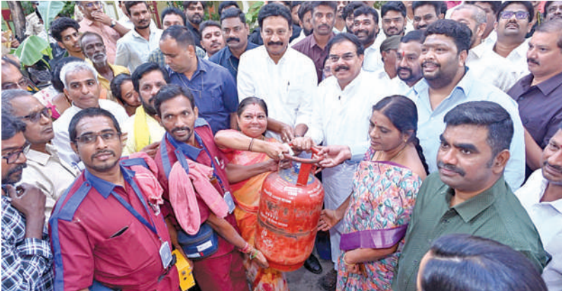
శ్రీకాకుళం జిల్లాలో లక్షల మందికి గ్యాస్ సిలెండర్లు అందజేస్తున్న మంత్రి నాదెండ్ల మనోహర్ రాష్ట్రాన్ని సందర్శించి

3 వారాల్లో 50 లక్షల సిలిండర్లు పంపిణీ మంత్రి నాదెండ్ల మనోహర్ తెలుగుకుటుంబాన్ని రాష్ట్ర పౌర సరఫరాలు, విజయవాడ, నవంబరు 22 ప్రభాతవార్త ప్రతినిధి: ఆహారం, వినియోగదారుల వ్యవహారాల దీపం. పథకంపై లక్షల మందికి గ్యాస్ సిలెండర్లు పంపిణీ చేసిన మనోహర్ తెలిపారు. >>2